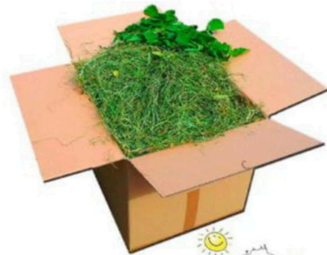
Mezcla de Cortes Zollernalb-Heno de Montaña con Hierbas