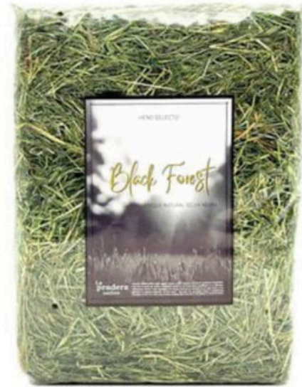
Heno Black Forest

Henos verdes, sin polvo, que huelan bien. LaPraderaonline.com y Herrenutricionanimales.es son buenos sitios para comprar online. Orycs en algunas tiendas tambien es de buena calidad.