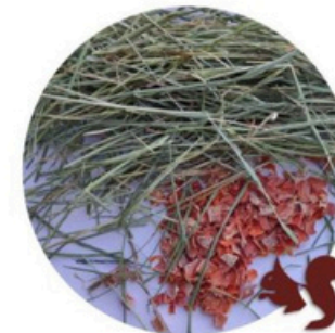
Heno de Festuca Extra Verde con Zanahor