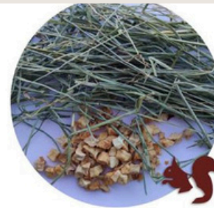
Heno de Festuca Extra Verde con Manzana