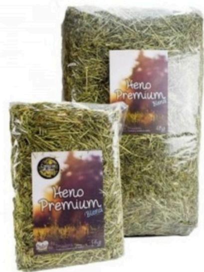
Heno Premium Blend (Mezcla de Cortes)