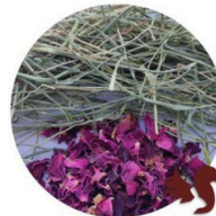
Heno de Festuca Extra Verde con Pétalos de Rosa