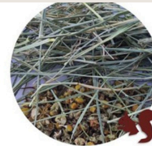
Heno de Festuca Extra Verde con Manzanilla